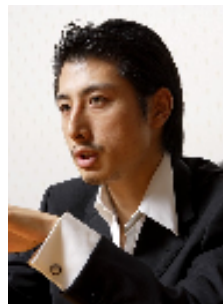
経営戦略研究所 株式会社 歯科医院地域一番実践会 地域一番化マスター